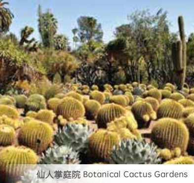
仙人掌庭院 Botanical Cactus Gardens