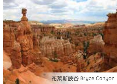
布萊斯峽谷 Bryce Canyon