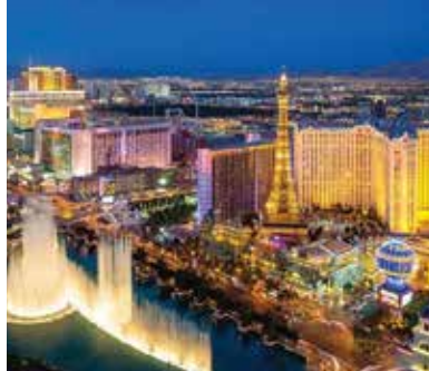
拉斯維加斯夜遊 Las Vegas night tour