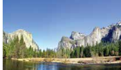
優勝美地國家公園 Yosemite National Park