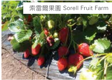
索雷爾果園 Sorell Fruit Farm