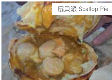
扇貝派 Scallop Pie