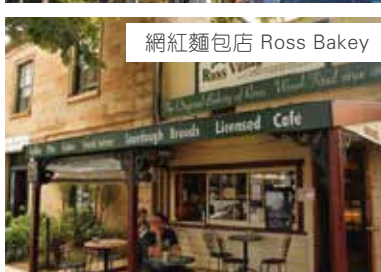
網紅麵包店 Ross Bakery