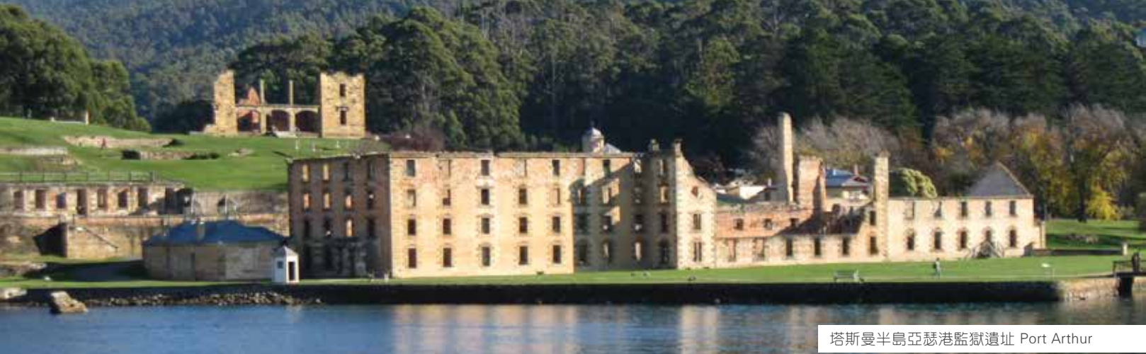
塔斯曼半島亞瑟港監獄遺址 Port Arthur