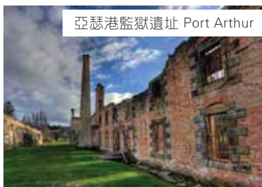
亞瑟港監獄遺址 Port Arthur