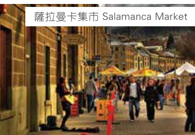
薩拉曼卡集市 Salamanca Market