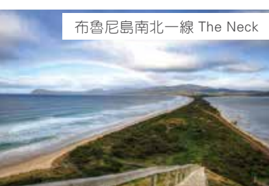
布魯尼島南北一線 The Neck