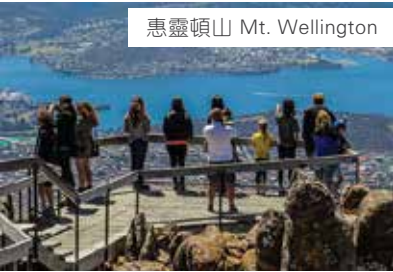
惠靈頓山 Mt. Wellington