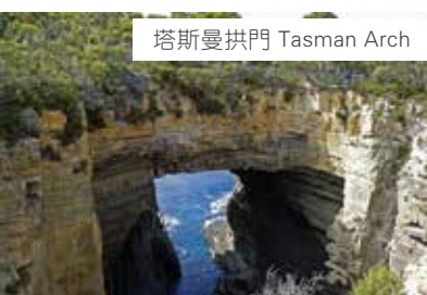
塔斯曼拱門 Tasman Arch