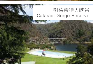
凱德奈特大峽谷 Cataract Gorge Reserve