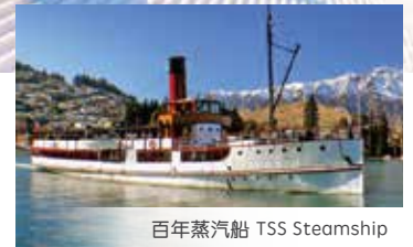
百年蒸汽船 TSS Steamship