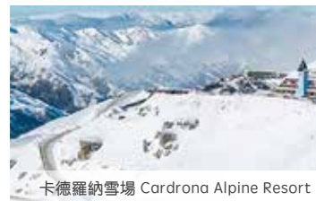
卡德羅納雪場 Cardrona Alpine Resort