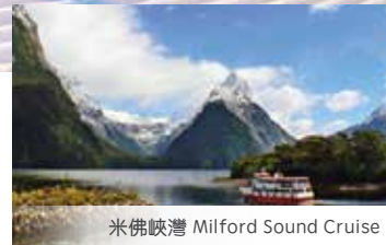
米佛峽灣 Milford Sound Cruise

此傳單所列的團所有節目安排按當地狀況決定，本公司有權適時調整瀏覽安排，並保留最終決定和解釋權。如因個人原因、罷工、天氣、政治因素、戰爭、災難或其他人力不可抗拒等因素所引起的額外費用，本公司不承擔任何責任。