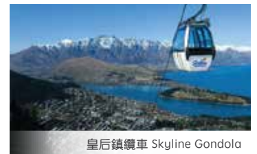
皇后鎮纜車 Skyline Gondola