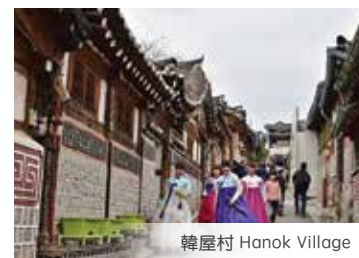
韓屋村 Hanok Village