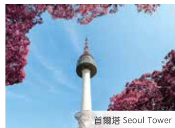
首爾塔 Seoul Tower