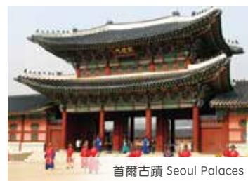
首爾古蹟 Seoul Palaces