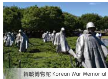
韓戰博物館 Korean War Memorial