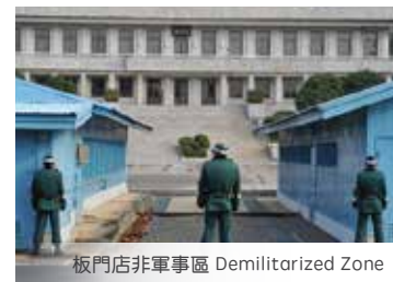
板門店非軍事區 Demilitarized Zone