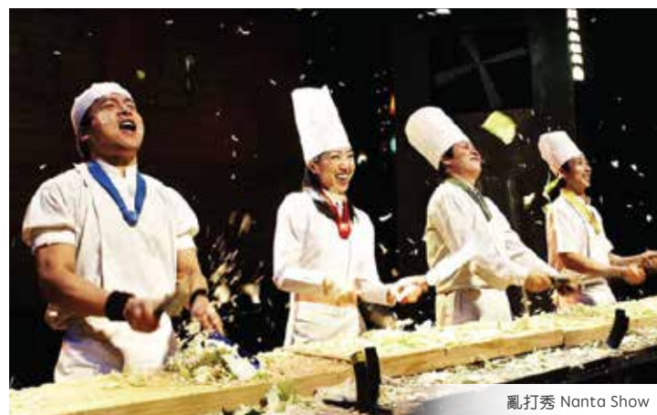
亂打秀 Nanta Show

此傳單所列的團所有節目安排按當地狀況決定，本公司有權適時調整瀏覽安排，並保留最終決定和解釋權。如因個人原因、罷工、天氣、政治因素、戰爭、災難或其他人力不可抗拒等因素所引起的額外費用，本公司不承擔任何責任。