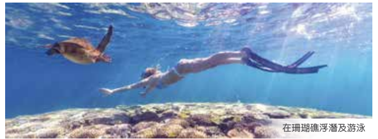
在珊瑚礁浮潛及游泳