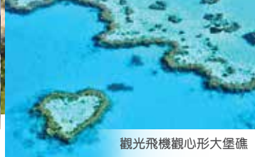
觀光飛機觀心形大堡礁