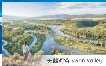
天鵝河谷 Swan Valley