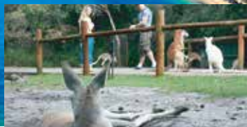
凱維森動物園 Caversham Park