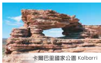
卡爾巴里國家公園 Kalbarri