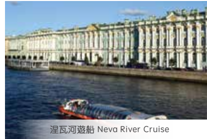
涅瓦河遊船 Neva River Cruise