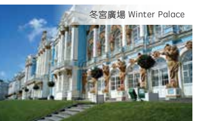
冬宮廣場 Winter Palace