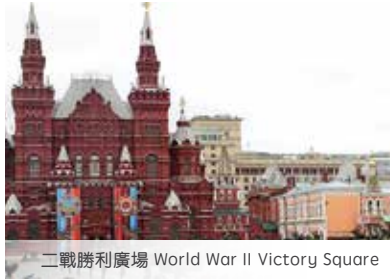
二戰勝利廣場 World War II Victory Square