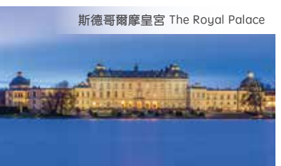
斯德哥爾摩皇宮 The Royal Palace

早餐後根據客人航班分批送機前往莫斯科。機票自理，請訂11am後離開哥本哈根CPH的航班，莫斯科SVO免費接機時間：4pm & 8pm；其他時間：CPH送機$35/人，2人起；SVO接機7座車司導(適合4人+3個行李) AUD$280/次。After breakfast, transfer to CPH airport and flight to Moscow, airfare on your own expense. Free drop off at CPH Airport: flights departing after 11am. Free pick up at SVO Airport at 4pm & 8pm.