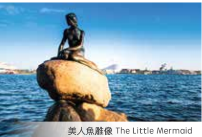
美人魚雕像 The Little Mermaid

團費$ 2398 起 Tour Fee fr 從哥本哈根出發 Depart from Copenhagen