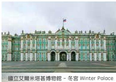
國立艾爾米塔基博物館 - 冬宮 Winter Palace