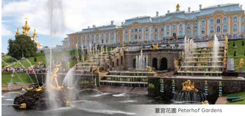
夏宮花園 Peterhof Gardens