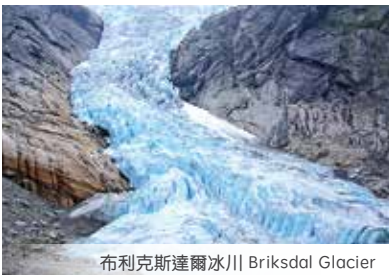
布利克斯達爾冰川 Briksdal Glacier