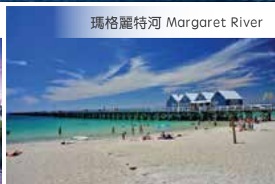
瑪格麗特河 Margaret River