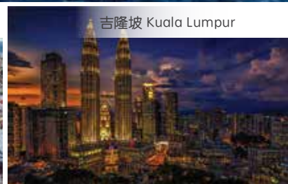
吉隆坡 Kuala Lumpur