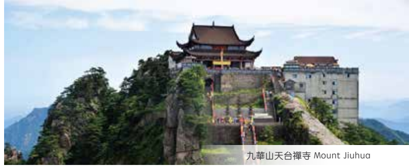
九華山天台禪寺 Mount Jiuhua

根據航班情況安排成都市內觀光，飛往太原，抵達後前往酒店休息。 1. Chengdu city tour (subject to change), 2. Fly to Taiyuan & transfer to hotel