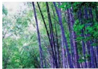
紫竹林 Purple Bamboo Forest