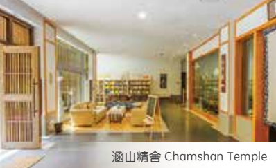
涵山精舍 Chamshan Temple