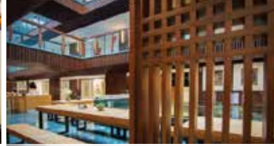
橫院禪文化酒店 Hotel Zen Urban Resort