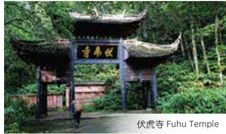
伏虎寺 Fuhu Temple