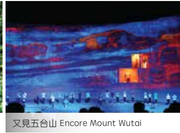
又見五台山 Encore Mount Wutai