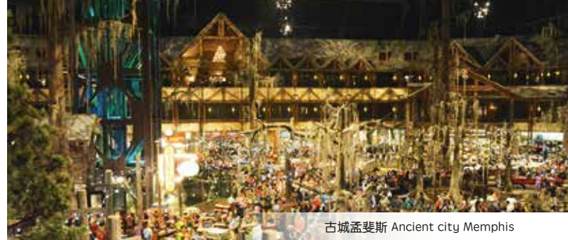
古城孟斐斯 Ancient city Memphis

早餐後自由活動，可參加推薦項目【阿布辛貝神廟】 (USD$130)。阿布辛貝神廟、哈索爾神廟及它下游至菲萊島的許多遺跡，都是努比亞遺址，被聯合國教科文組織指定為世界遺產。參觀完畢搭車返回遊輪。下午遊輪開往孔翁坡，抵達後參觀【孔翁坡神廟】，是一座同時供奉老鷹神荷魯斯Haroeris以及鱷魚神索貝克Sobek的雙神廟。後返回遊輪晚餐並休息。遊輪繼續前往艾德芙。 After breakfast, free at your own leisure. 1. Optional: Abu Simbel Temple (USD$130, at your own expense). 2. Kom Ombo, 3. Temple of Kom Ombo, 4. continuous to Edfu