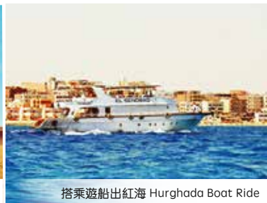
搭乘遊船出紅海 Hurghada Boat Ride