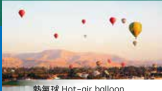
熱氣球 Hot-air balloon