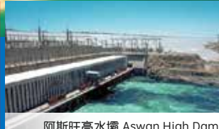
阿斯旺水壩 Aswan High Dam