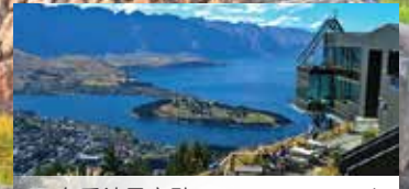
皇后鎮最高點 Queenstown Peak