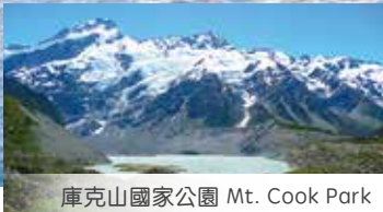
庫克山國家公園 Mt. Cook Park