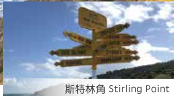
斯特林角 Stirling Point