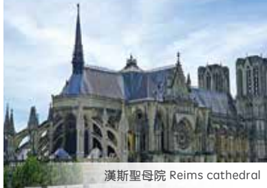
漢斯聖母院 Reims cathedral

前往英格蘭北部的湖區遊覽【湖區國家公園】。參加【溫德米爾湖遊船】(€7.2) 或拜訪【彼得兔博物館】。前往曼徹斯特，是足球勁旅曼聯的總部，遊覽市