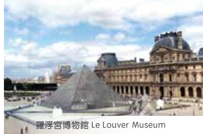
羅浮宮博物館 Le Louver Museum

內建築物，可自行前往英超曼聯主場【奧脫福球場】(€16) 朝聖，可自費享用【唐人街晚餐】。1. Lake District National Park, 2. Windermere Lake Cruise^(€7.2), 3. Peter Rabbit Museum, 4. FCManchester United Old Trafford Stadium^(€16), 5. Chinatown Dinner^