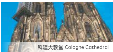
科隆大教堂 Cologne Cathedral