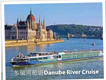
多瑙河船遊Danube River Cruise