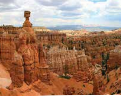
布萊斯峽谷 Bryce Canyon