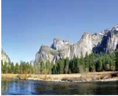
優勝美地國家公園 Yosemite National Park