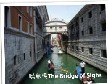
嘆息橋The Bridge of Sighs