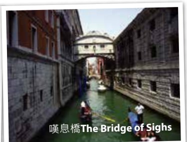
嘆息橋The Bridge of Sighs