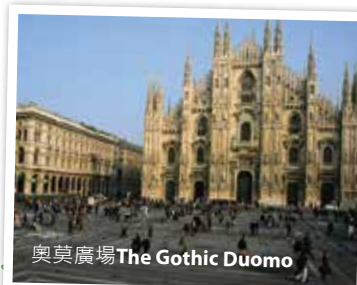
奧莫廣場The Gothic Duomo