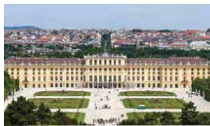
遜布倫宮 Schonbrunn Palace