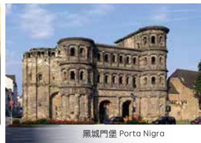
黑城門堡 Porta Nigra