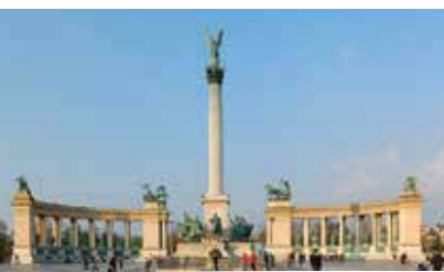
英雄廣場 Heroes Square