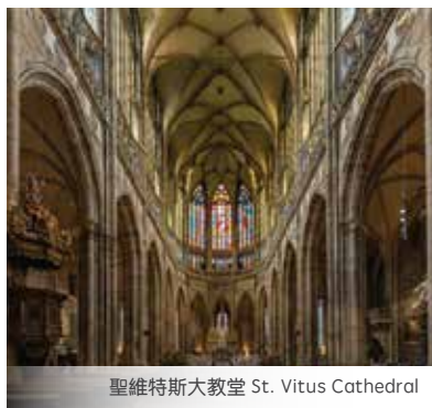
聖維特斯大教堂 St. Vitus Cathedral