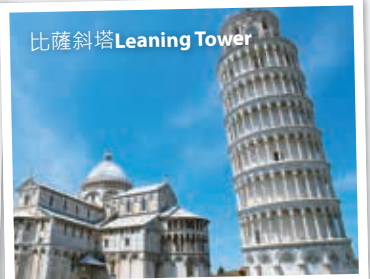
比薩斜塔 Leaning Tower