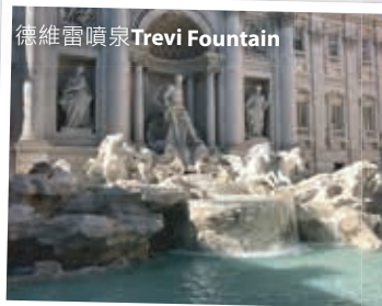
德維雷噴泉 Trevi Fountain

報名后在任何情況下取消訂位：出發日期前21天以外可免費取消；出發日期前15-20天取消扣50%團費；出發日期前14天內取消全款不退。