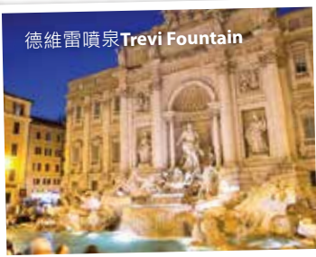
德維雷噴泉 Trevi Fountain