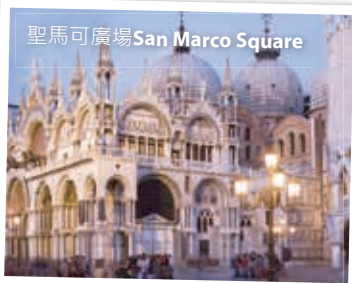
聖馬可廣場 San Marco Square

酒店早餐後前往時尚之都米蘭，遊覽多奧莫廣場的 gothic Duomo、維多利亞伊曼紐二世商店街 Galleria Vittorio Emanuele II，巨大拱形建築和玻璃閃閃生輝的天花板，富麗堂皇，多奧莫大教堂，規模僅次於羅馬的聖彼得大教堂，極具觀光價值；遊罷驅車前往威尼斯，晚宿於威尼斯或鄰近城市。