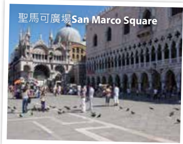
聖馬可廣場 San Marco Square

酒店早餐後前往時尚之都米蘭，遊覽多奧莫廣場the gothic Duomo、維多利亞伊曼紐二世商店街century Galleria Vittorio Emanuele II，巨大拱形建築和玻璃閃閃生輝的天花板，富麗堂皇，多奧莫大教堂，規模僅次於羅馬的聖彼得大教堂，極具觀光價值；遊罷驅車前往威尼斯，晚宿於威尼斯或鄰近城市。