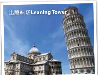
比薩斜塔 Leaning Tower