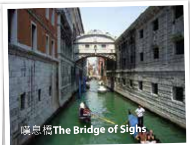
嘆息橋The Bridge of Sighs