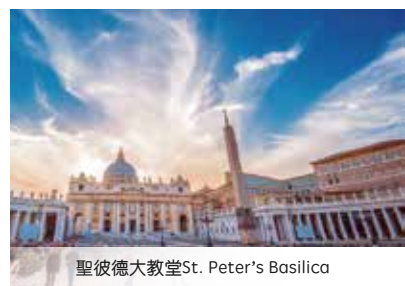
聖彼得大教堂St. Peter's Basilica