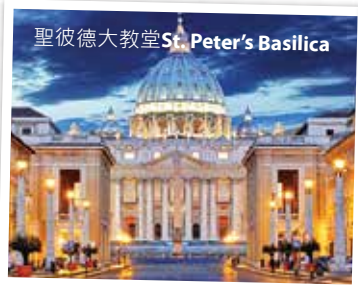
聖彼得大教堂St. Peter's Basilica

早餐於酒店後，前往法國香檳之都漢斯；漢斯是目前香檳區的經濟首府，也是法國歷史上相當重要的城市，素有「王者之城」之稱the city's cathedral，因為11世紀開始，法國國王都必須到這個「加冕之都」受冕登基，漢斯聖母院也就成為漢斯最重要觀光點。遊覽驅車往小國盧森堡進發，抵步後遊覽市區亞道夫大橋Pont Adolphe、峽谷The Canyon、憲法廣場Place de Constitution等景點；是晚住宿於盧森堡或鄰近城市。