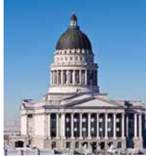
州政府大廈 Utah State Capitol