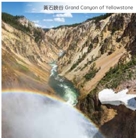
黃石峽谷 Grand Canyon of Yellowstone

第6天 黃石國家公園 > 大提頓國家公園 > 傑克森 > 鹽湖城 Residence Inn Suites Marriott Cottonwood 或同級 Yellowstone > Grand Teton National Park > Jackson > Salt Lake City