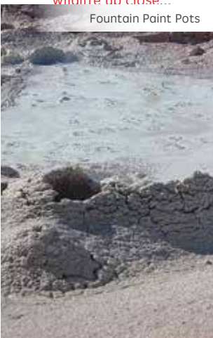
Fountain Paint Pots