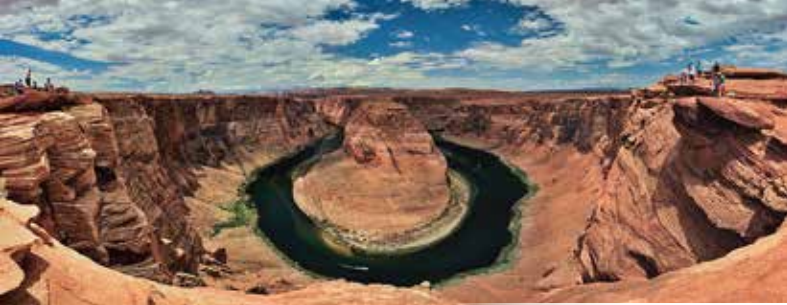
科羅拉多河 Colorado River