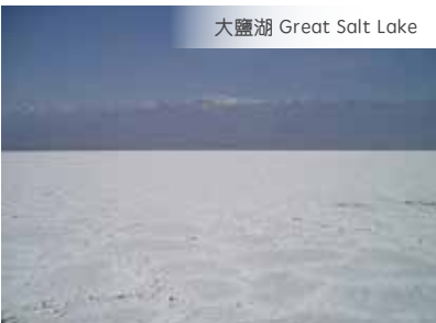
大鹽湖 Great Salt Lake

清晨欣賞日出，推薦自費【搭乘直昇機到谷底^】及【乘坐遊艇^】飽覽【科羅拉多河】兩岸的壯麗風光！推薦自費【羚羊彩穴^】世界十大最著名攝影地點之一！每個人都會成為攝影師，為自己的旅程拍出難忘的照片。隨後前往【馬蹄灣*】國家地理雜誌評選出的美國十大最佳攝影地點之一！夜宿卡奈布。 1. View the sun raise, 2. Colorado River, 3. Recommend optional: take a helicopter tour^ & Ferry^ to the bottom of the Grand Canyon^, 4. Antelope Canyon^: Top 10 most famous photography locations! 5. Horseshoe Bend*: Top 10 most popular photography sites in America!