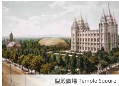
聖殿廣場 Temple Square

1. Continue to explore Yellowstone National Park, 2. Grand Teton National Park*, 3. Famous cowboy town: Jackson, 4. Overnight Salt Lake City