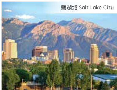
鹽湖城 Salt Lake City

第4天 布萊斯峽谷國家公園 > 鹽湖城 > 普克泰羅 | Red Lion Pocatello 或同級 Bryce Canyon National Park > Salt Lake City > Pocatello