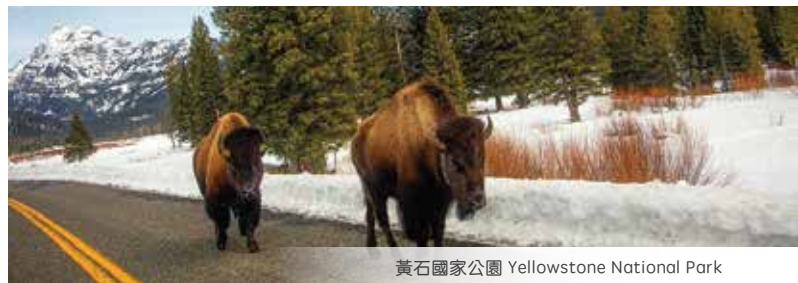
黃石國家公園 Yellowstone National Park

1. Ethel M Chocolate Factory, 2. Botanical Cactus Gardens 3. Tanger Outlets in Barstow, 4. Airport transfer Please schedule your flights to depart from Los Angeles (LAX) after 9:30pm (Domestic Flight) or 10:30pm (International Flight).