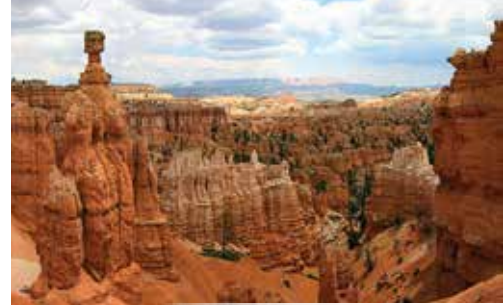
布萊斯峽谷 Bryce Canyon

第1天 抵達洛杉磯 Arrive Los Angeles | Holiday Inn 或同級 導遊將在國際航班出口處迎接，接機時間 (8:30am-10pm)。 Free hotel transfer (8:30am - 10pm) at LAX Airport Arrival Exit.